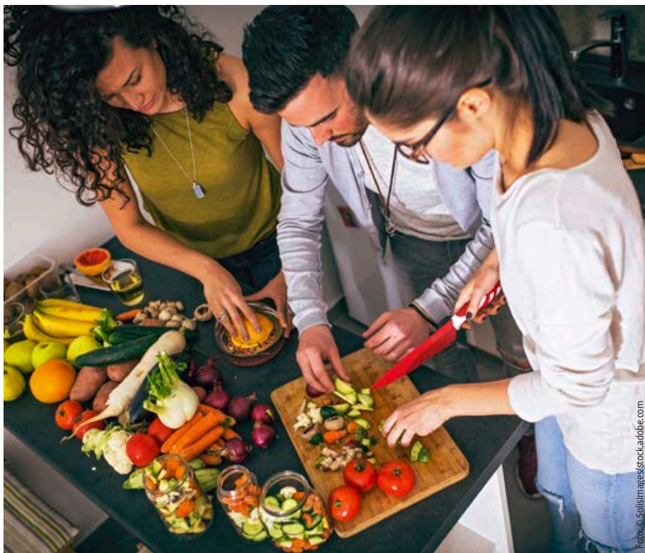
Mit vegetarischer Kost ist der Bedarf an Vitaminen und Mineralstoffen gut bis sehr gut zu decken.

zehr von zehn Gramm Algen zugrunde liegt, halten die Autoren das empfohlene eine Gramm Norialgen in den vegetarischen Tagesplänen für unproblematisch. In der Ernährungsberatung sollten Verbraucher darauf hingewiesen werden, die auf der Verpackung angegebenen Jodgehalte sowie die maximale tägliche Verzehr dosis zu berücksichtigen. Vegetarier, die keine Algen essen möchten, können nach Rücksprache mit dem Hausarzt alternativ Jodtabletten verwenden. Diese Empfehlung gilt auch für Mischköstler, die wenig oder gar keinen Fisch essen. Keinesfalls sollte die Jodzufuhr durch einen überhöhten Konsum von jodiertem Speisesalz erfolgen. Der empfohlene Richtwert von maximal sechs Gramm Salz pro Tag ist einzuhalten.