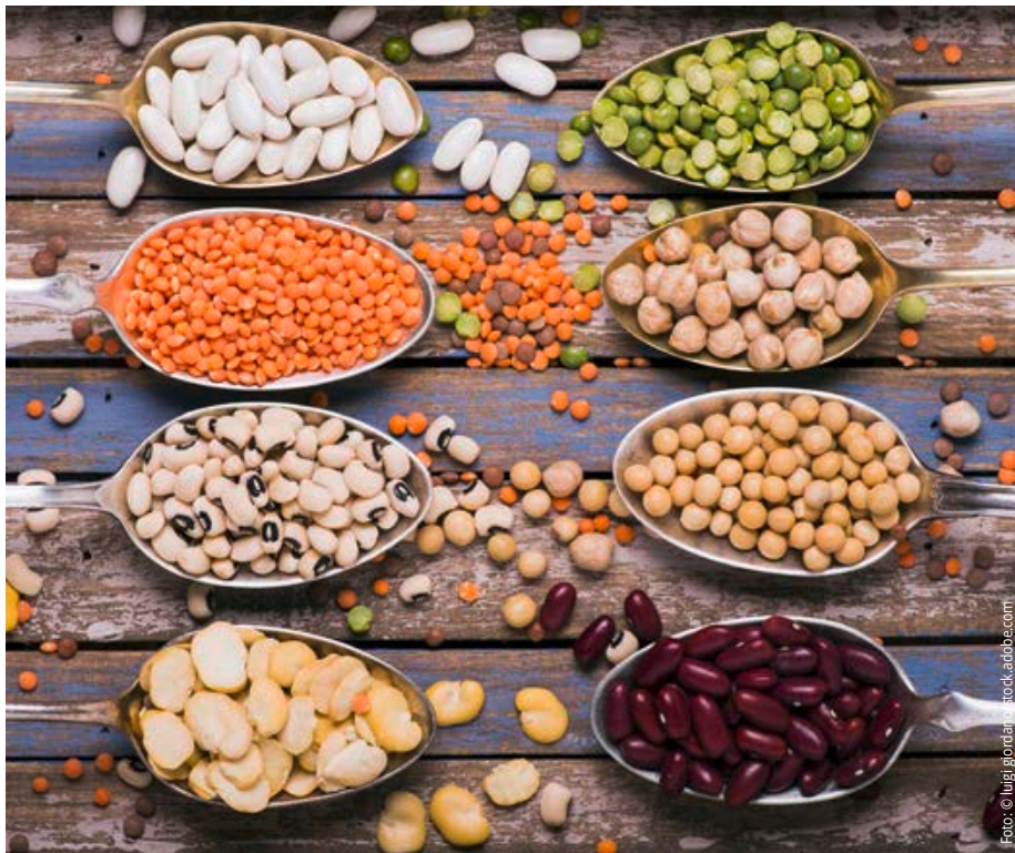
Hülsenfrüchte als pflanzliche Proteinlieferanten ergänzen die Gruppe Milch, Milchprodukte und Milchalternativen.