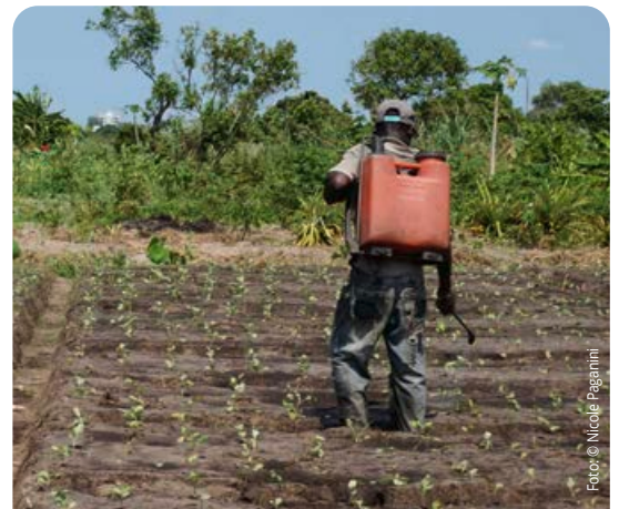
In Maputo werden großzügig Insektenvernichtungsmittel aufgetragen – ohne jede Schutzkleidung.

In Khayelitsha, dem größten Township der Cape Town Metropolitan Area gelten 89 Prozent der Haushalte als ernährungsunsicher ( Battersby in Paganini, Schelchen 2018 ). Hinterhof- und Gemeinschaftsgärten produzieren für den Eigengebrauch, den Markt erreichen die meisten lediglich mit Unterstützung