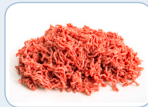
Fleisch, z. B. Hackfleisch, Hähnchen oder Kasseler