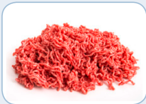
Fleisch, z. B. Hackfleisch