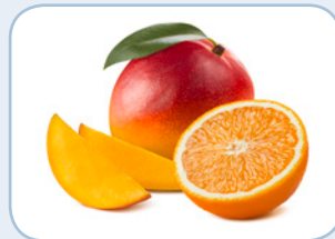
Apfel, Orangen, Mango, z. B. als Rohkost oder Salat