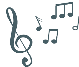
Licht, Duft und Musik