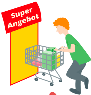
Aufsteller in den Gängen