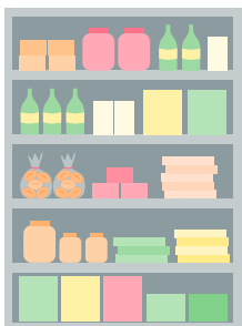
Preiswertes ist weit oben oder unten, Teures und Neues in Sichthöhe